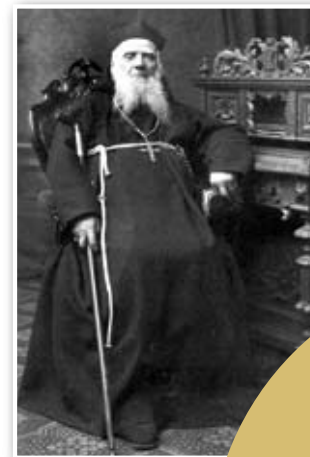
Guglielmo Massaja Missionario Cappuccino e Vicario Apostolico in Etiopia